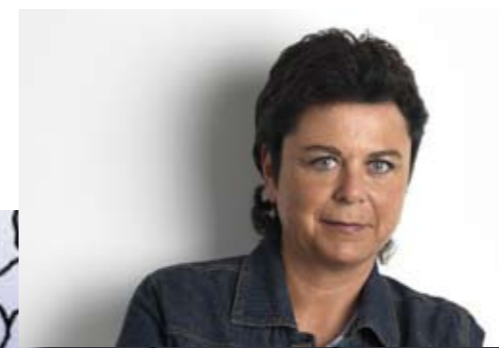
Carla Dejonghe Schepen - Brussels Parlements lid