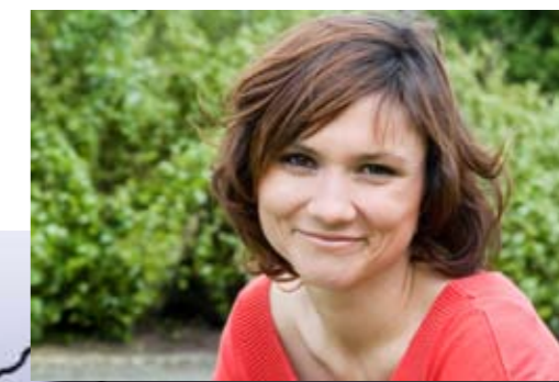
Irina De Knop Schepen - Vlaams Parlements lid